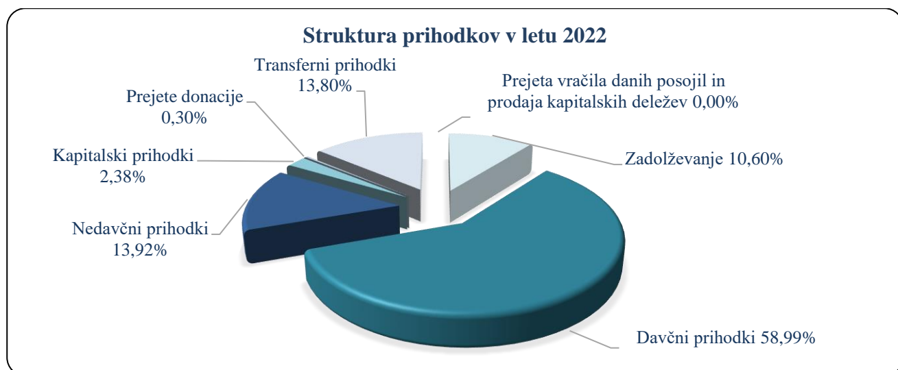
Slika 1: Struktura prihodkov v letu 2022