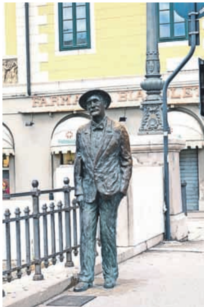
James Joyce na Rusem mostu