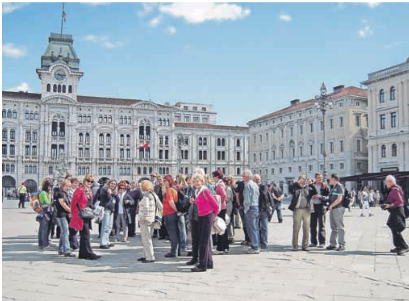
Na Velikem trgu