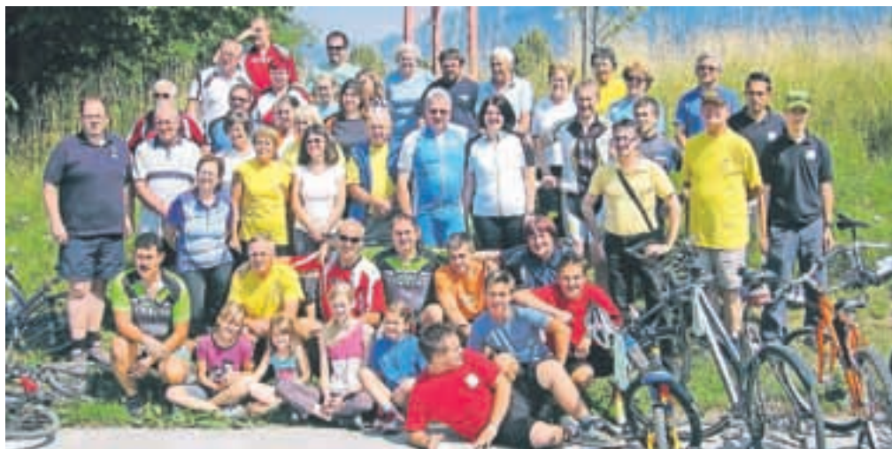
Udeleženci 13. Leškega kolesarskega kroga

Na praznik krajevne skupnosti Lesce so svoj kamenček k praznovanju dodali tudi kolesarji. Lani so bile izredno slabe vremenske razmere, a kljub vsemu so se na leškem kolesarskem krogu zbrali trije najbolj vztrajni in poskrbeli, da se tradicija vsakoletnega kolesarjenja ni prekinila. Letošnja prireditev niti malo ni bila vprašljiva, saj je sončno jutro privabilo na plan še tiste zadnje skeptike, ki so kolebali na kolo da ali ne. Osmo ura je pomenila zbor za tiste, ki so si upali malce več, za pot, dolgo 35 km, ki je vodila na relaciji od Lesc, Radovljice, čez Lancovo, Lipnico, Podnart, Zaloše, Otoče, Posavec, Brezje, Spodnji Otok, Zapuže, Hlebce, Studenčice, Hraše, nazaj do Lesc. Daljše poti se je udeležilo 38 kolesarjev. Še večja udeležba je bila na