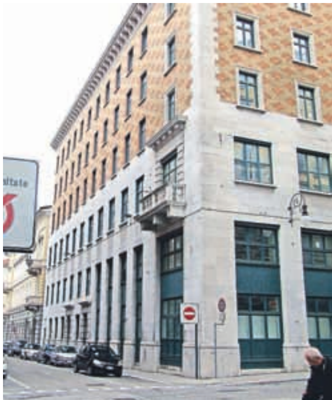
Narodni dom, požgan leta 1920