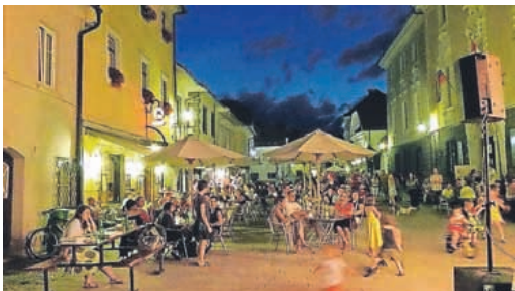
"Večerno vzdušje", avtor Ljubo Kozic (diploma)