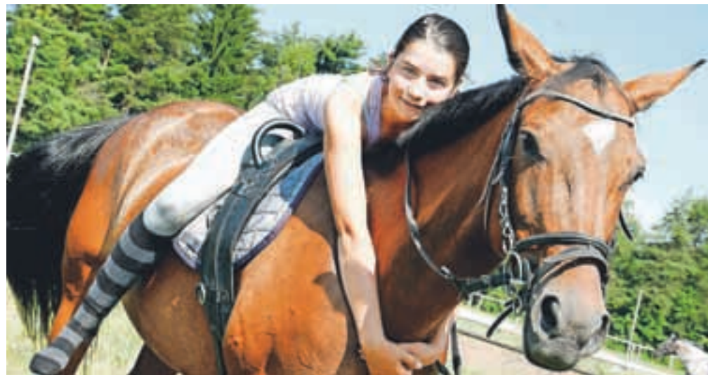
Najvažnejša razsežnost terapevtskega jahanja je pomemben stik dveh teles.

Kot pravi Ipavčeva, so zato tudi na Gorenjskem želeli oblikovati program za aktivnosti in terapije s pomočjo konj, ki bi povezoval strokovnjake in terapevte za ranljive ciljne skupine. »Skozi program povezane terapevte bomo približali