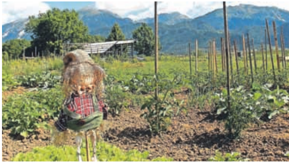
Predem sem sploh lahko začela vrtnariti, je bilo treba zemljo dobro očistiti kamenja in travne ruše.

Rečeno, storjeno. Na občino sem se šla pozanimat, ali je na voljo še kakšen vrtniček. Bilo jih je še toliko, da sem lahko izbirala. Pa sem si rekla, zakaj ne bi vzela kar dveh, saj 200 kvadratov ne more biti prav veliko. Potem sem zavila v trgovino z vrtnarskimi pripomočki, kupila slamnika, gumijaste škornje, samokolnico in nekaj