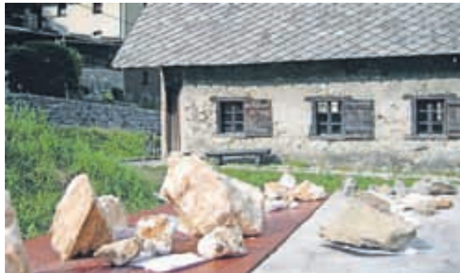
... in pred vigenjcem Vice.