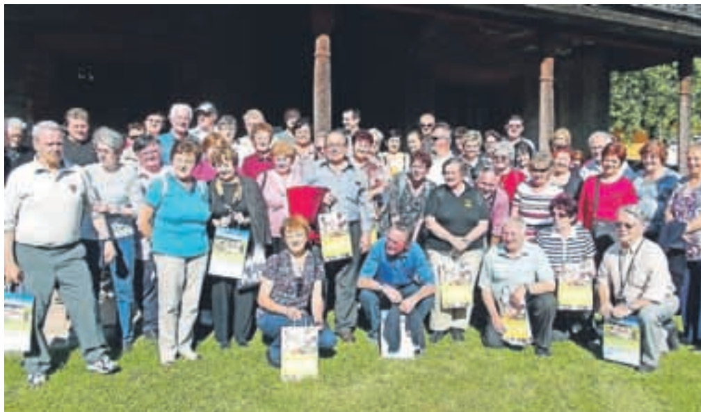
V turističnem društvu Begunje vsako leto pripravijo izlet za člane in krajanje po domačih in tujih krajih. Tokratna pot jih je vodila v zanimiv in zgodovinsko povezan kraj Bad Vigaun, vasico, ki leži ob vznožju visokih solnograških gora.