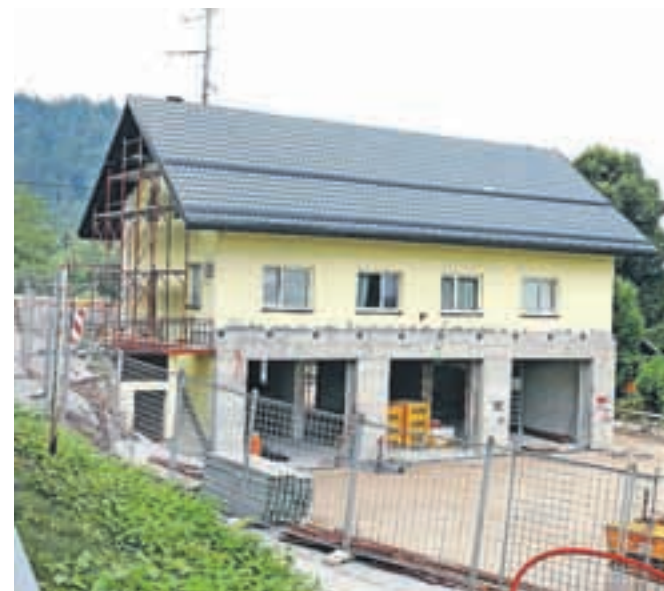
Rekonstrukcija stavbe Gasilskega doma v Podnartu teče po načrtih.

Spomladi so v Podnartu začeli obnavljati stavbo Gasilskega doma. Veliko prostovoljnega dela, podpora krajanov.