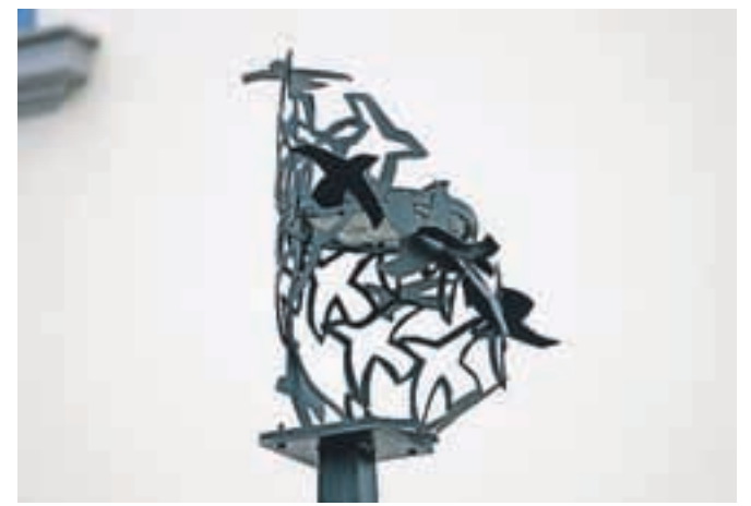
Na vsaki svetilki je tudi ime avtorja. Svetilka na fotografiji je nastala po predlogi Črta Freliha iz Radomelj.