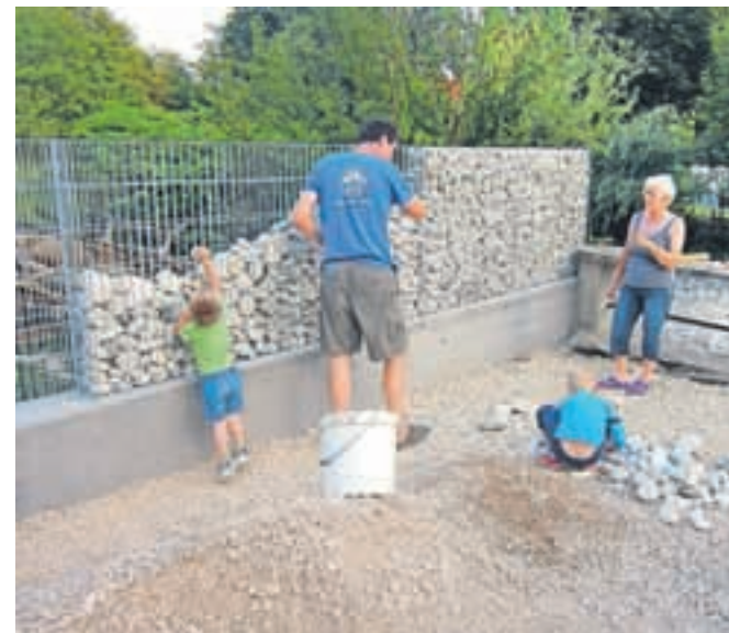
Veliko dela opravijo gasilci sami – tako so pred kratkim v delovni akciji uredili kamnito ograjo.

stva za nakupovanje opreme in pokrivanje tekočih stroškov smo si pridobili iz občinskega proračuna in donacij. Letos smo začeli z realizacijo svojega velikega projekta. Z zaključkom se nam bo uresničila tudi naša dolgoletna želja po urejenem in spodobnem gasilskem domu,« poudarjajo gasilci, ki za zaključek 364 tisoč evrov vredne investicije potrebujejo še nekaj več kot 40 tisoč evrov. Zato so podjetjem in posameznikom poslali prošnje za finančno pomoč. »Doslej nas še nihče ni zavrnil,« pravijo gasilci, ki imajo pomembno mesto v življenju skupnosti.