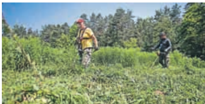
Letos so se akciji odstranjevanja invazivnih tujerodnih rastlin pridružili tudi delavci Kampa Šobec.

Kot poudarjajo na zavodu za varstvo narave, imajo invazivne tujerodne vrste veliko negativnih vplivov tako na gospodarstvo in zdravje ljudi kot na biotsko pestrost in krajinsko podobo naših krajev. Na območju občin Radovljica in Bled sta predvsem problematični dve tujerodni vrsti zlate rozge, kanadska in orjaška zlata rozga, ki se širita po travnikih, ob gozdnih robovih in mokriščih. Postopoma odvzemata življenjski prostor domorodnim vrstam, kot so različne travniške cvetlice, kukavičevke ali orhideje in rastline, vezane na barja in močvirja. Akcija je del projekta projekta Amc Promo BID, podprli pa sta jo tako občina Radovljica kot tudi občina Bled.