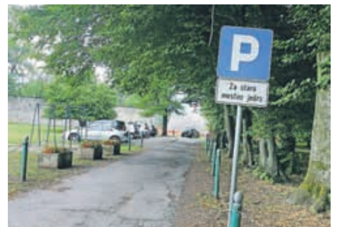
Staro parkirišče v grajskem parku bodo zaprli še pred koncem leta.