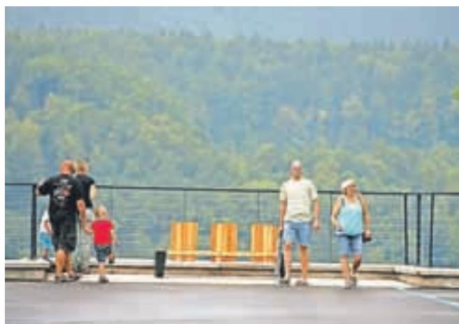
Na razgledni ploščadi se odpira pogled na Savo in Jelovico.