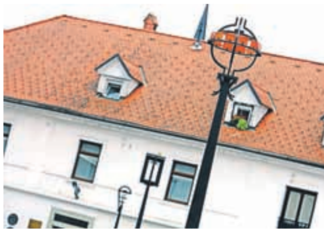
Svetilke na parkirišču so delo domačih umetnikov in kovačev iz Kroke.