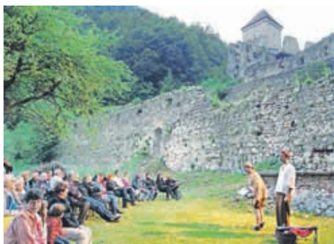
Naravna kulisa gradu je bila odlično prizorišče za obuditev legende o Erazmu Predjamskem.

Naravna kulisa gradu je bila odlično prizorišče za obuditev legende o Erazmu Predjamskem. Igralcema Teatra Cizamo so pri šaljivi uprizoritvi zgodbe o Erazmu pomagali tudi naključni gledalci, ki so se takoj vživel v vloge in jih odlično odigrali. Za zaključek pa je občinstvo, ki je uživalo v pestrem dogajanju ob kresni noči, ponovno navdušila skupina Čupakabra, ki je v soju ognja razsvetlila grad. Kres je zagorel in nekoliko podaljšal svetlobo noči, ki se spet daljša in čaka, da se vrne ob letu osorej.