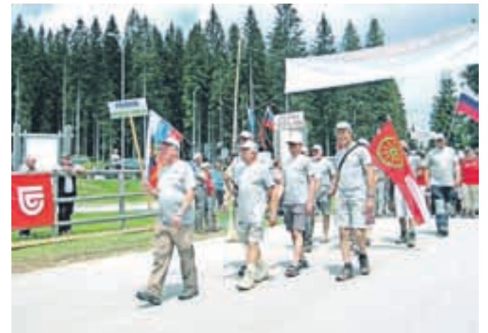
Med pohodniki so bili tradicionalno tudi Radovljičani.

"Naj vas zato ob vrnitvi z najvišjega slovenskega vrha pričakam in pozdravim s prošnjo in povabilom: pomagajte nam graditi to soglasje – aktivno, glasno državljansko soglasje, pomagajte nam graditi Slovenijo prihodnosti,« je nagovorila pohodnike. "Danes sem z vami tu, ker hočem z vami deliti radost tega, da opraviš kakšno pot tudi v dnevu ali dveh. Hočem postati z vami in slišati, kako je, če zjutraj kreneš in si pred mrakom že na cilju, kako je, če se ti dan kaže kot nov izziv, ne pa kot nevarnost," je še dejala Alenka Bratušek.