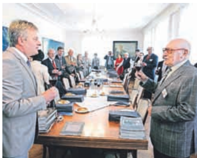
Radovljica je v začetku junija gostila upravo Mednarodnega združenja Chopinovih društev, ki se je v prostorih občine sestala na svojem letnem srečanju, ki ga je organizirala radovljiška ustanova Chopinov zlati prstan.