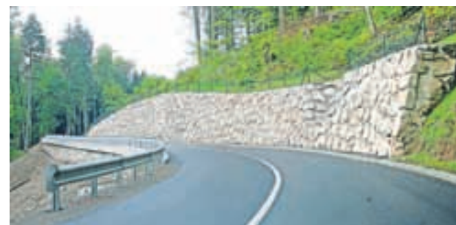
V začetku meseca je spet stekel promet po prenovljenem odseku regionalne ceste na Lancovem.