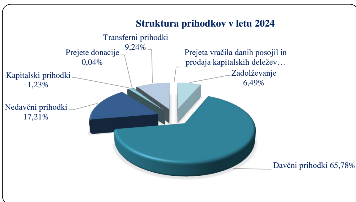
Slika 1 Prikaz prihodkov po deležu znotraj proračuna v letu 2024