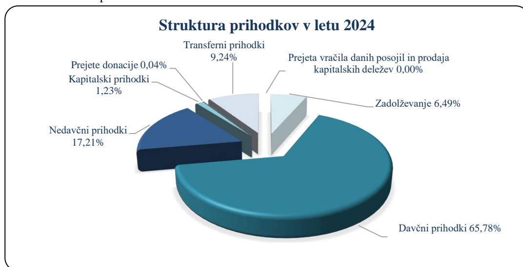
Slika 1: Struktura prihodkov v letu 2024