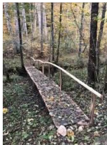
Vodna učna pot Grabnarca