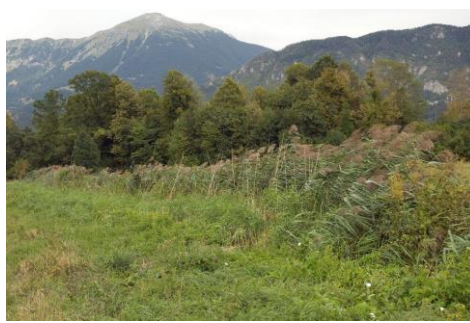
Blatnica, Hraše 2019