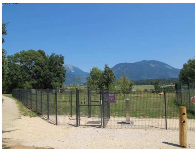
Pasji park Radovljica