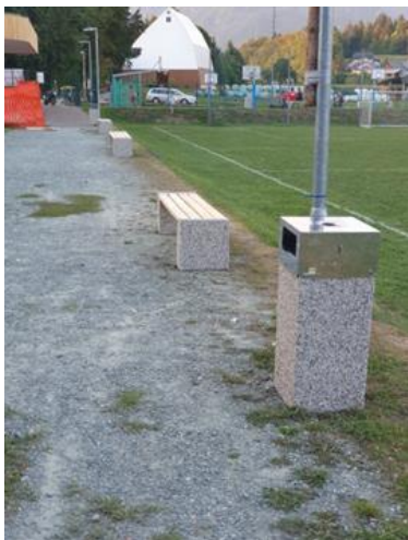
Zunanja ureditev Športnega parka Vrbnje

Stanje: Projekt je bil delno izveden v letu 2021, ko je bilo v celoti obnovljeno otroško igrišče, pridobljena so bila soglasja za namestitev lovilnih mrež, nameščene so bile spomladi v letu 2022. V septembru 2022 je bila nameščena še urbana oprema, s čimer je projekt zaključen.