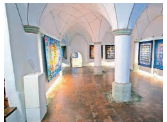
Razstava krpank je v galeriji Šivčeva hiša na ogled še do prihodnjega četrta, 6. januarja.