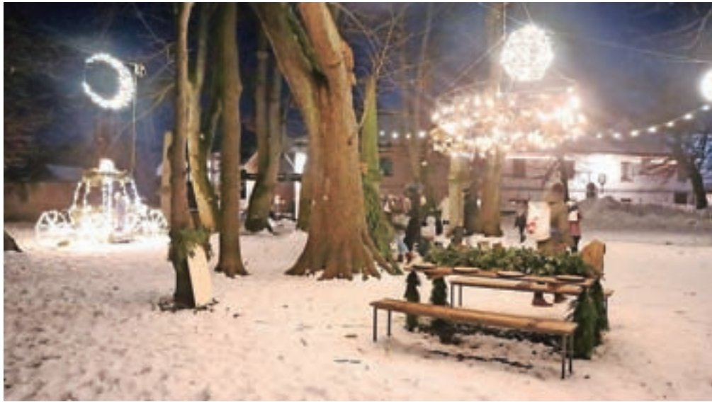
Čarobna decembrska družinska dogodivščina Potep k vilinskemu drevesu popelje po štirih točkah v mestu in se zaključi v pravljicnem parku s kočijo in praznično mizo.

"Na poti iz parka v mesto, ob krožišču pred mestnim jedrom, ne pozabite zaviti v čokoladnico Radolška čoko-