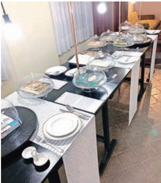
Knjige so predstavljene na mizi, pod pokrovi steklenih posod za pecivo, na prtih pa so natisnjeni Ivačičevi recepti.

Knjige so po zaslugi oblikovalke Tanje Devetak predstavljene malo drugače, kot je običajno pri muzejskih postavitvah. So na mizi, pod pokrovi steklenih posod za pecivo. Na prtih so natisnjeni njegovi recepti, mizo pa krasijo tudi krožniki in pribor, ki je bil v uporabi v časih, ko je kahal mojster