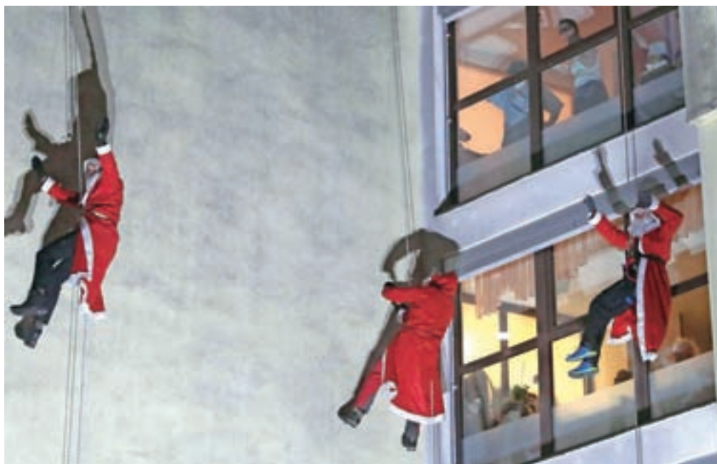
V veliko veselje stanovanke, zaposlenih in obiskovalke so se nekaj dni pred božičem z vrha domske stavbe spustili trije Božički.