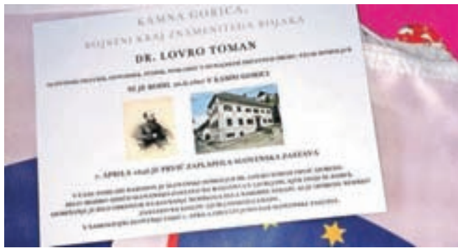
Voščilnicam, ki so jih prejeli v vseh gospodinjstvih, so letos dodali še zastavo, prijazen nagovor in posvetilo.