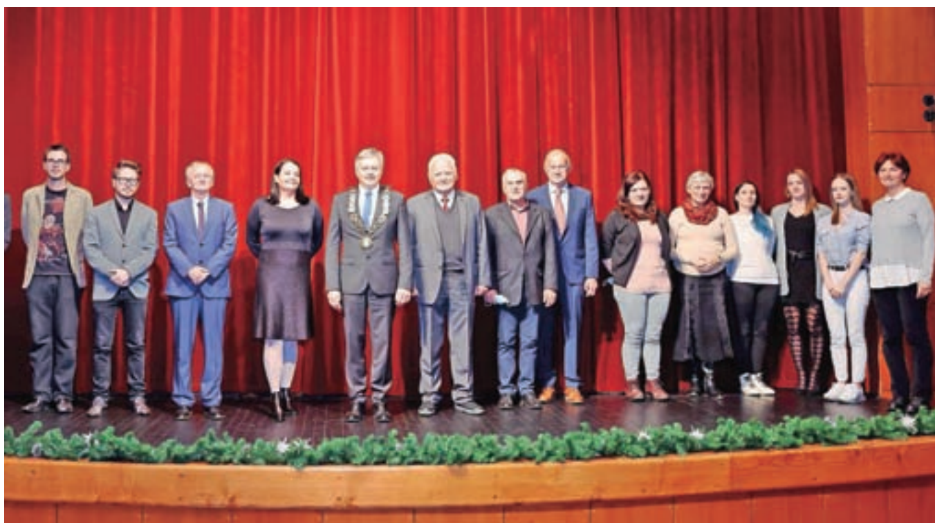
Nagrajenci z županom na odru Linhartarjeve dvorane, kjer so na predvečer občinskega praznika prejeli občinska priznanja