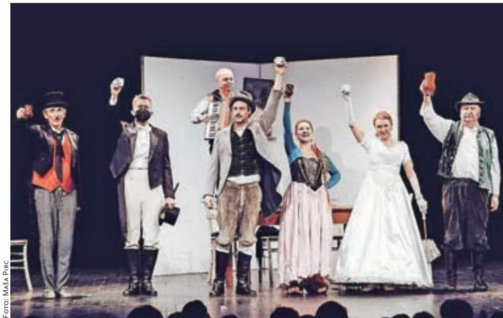
Živela, Micka, živel, Anže, živel, župan, in še na mnoga leta Linhartovi Županovi Micki