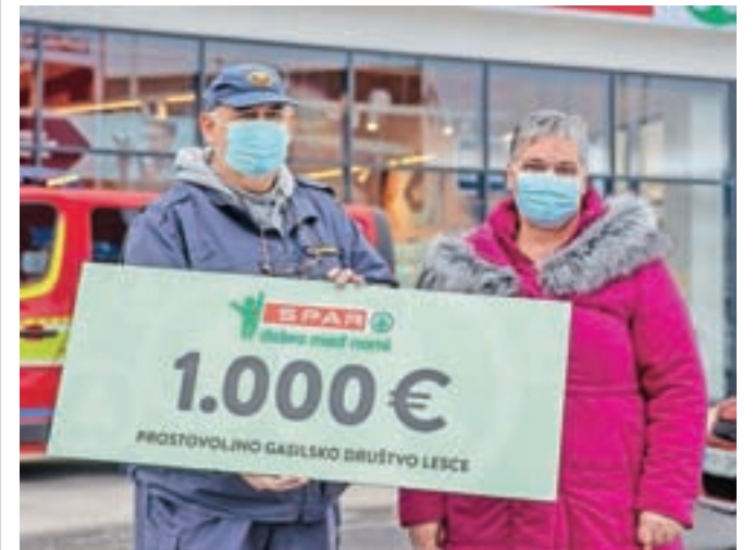
Med tremi lokalnimi organizacijami, ki so prejela donacijo ob odprtju nove trgovine, je tudi Prostovoljno gasilsko društvo Lesce.

zaposleni izbrali tri organizacije, ki jim je namenjena donacija, kupci pa so z glasovanjem določili višino sredstev, ki jih je prejela posamezna organizacija. Za donacijo v višini 1.500 evrov so izglasovali Varno hišo Gorenjske, ki bo sredstva namenila nakupu oziroma za mame in otroke, žrtve nasilja. Donacijo v višini tisoč evrov je prejelo Prostovoljno gasilsko društvo Lesce za nakup novega vozila, petsto evrov pa Center za usposabljanje, delo in varstvo Radovljica, ki bo sredstva namenil nakupu igral ter športnih pripomočkov.