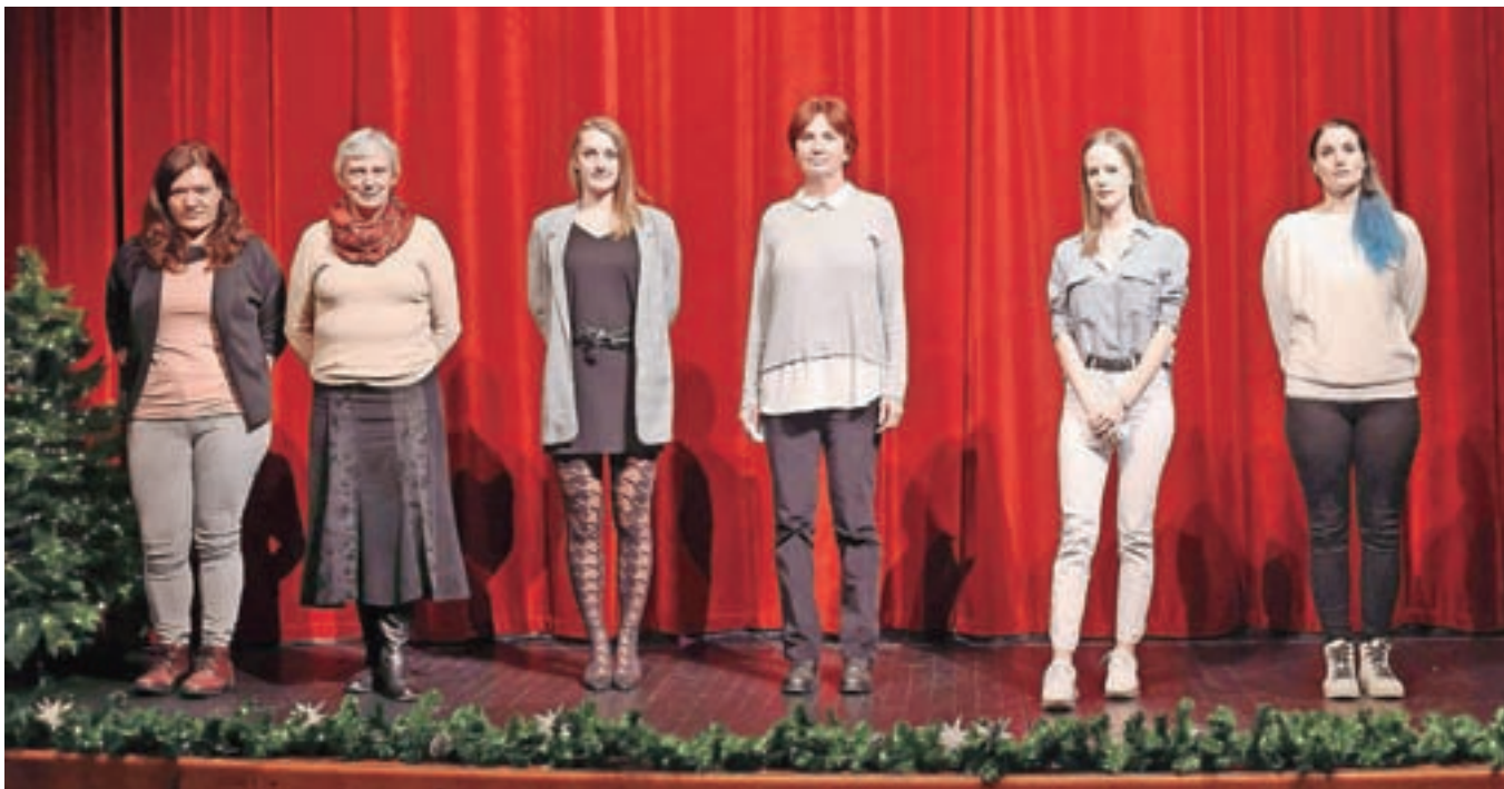
ProstoVOLJKJE v Domu dr. Janka Benedika

Učenci soustvarjajo različne prireditve, kot so proslave krajevnega praznika, prireditve ob materinskem dnevu in novem letu. V času epidemije se je šola uspešno prilagodila delu na daljavo ter s pomočjo staršev in učencev izvedla