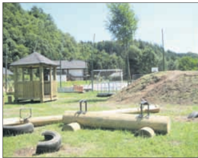
Razdejano otroško igrišče so domačini še tisto jutro za silo uredili.

Na novem otroškem igrišču, ki so ga v zadnjih mesecih z lastnim delom in denarjem ter sredstvi domačih podjetnikov uredili v Kamni Gorici, so neznanci sredi julija naredili popolno razdejanje. Igrišče je bilo urejeno s pomočjo domačih podjetij in zasebnikov, otroci pa so se na njem že nekaj časa igrali, zato je bil pogled na popolnoma razdejano igrišče še toliko bolj osupljiv. Domačini so bili v šoku, presenečeni, da se kaj takšnega lahko zgodi v kraju, znanem po svoji bogati kulturni dediščini, številnih prireditvah in lepih odnosih med ljudmi. »Uta, ki smo je postavili na vrhu manjše vzpetine, je bila prevrnjena in zakotaljena po igrišču, gugalnice polomljene, igrala razmetana vsepovsod. Eno od gugalnic smo našli celo v potoku!« jutranji pogled na uničeno igrišče opisujejo domačini. »K sreči še nismo postavili tobogana, saj bi ga skoraj zagotovo polomili. Že tako bodo stroški s popravili ogromni.« Da razdejanja ne bi videli otroci, so že tisto jutro, takoj potem, ko so o dogodku obvestili policijo, igrišče za silo uredili, uradno pa ga bodo, popravljenega, odprli ob krajevnem prazniku v začetku septembra. M. A.