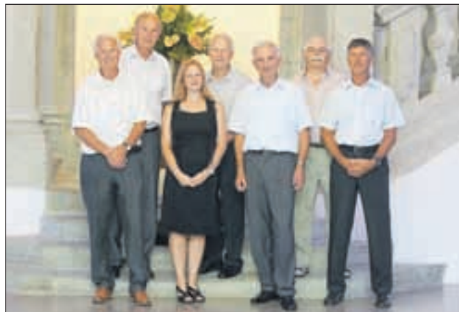
Skupina prostovoljcev Prava smer

Deželne novice izhajajo enkrat na mesec v nakladi 23.400 izvodov, brezplačno jih prejema vsa gospodinjstva in drugi naslovniki v občini Radovljica, priložene so tudi izvodom Gorenjskega glasa. Tisk: Delo, d. d., Tiskarsko središče. Distribucija: Pošta Slovenije, d. o. o., Maribor. Deželne novice so vpisane v Razvid medijev pod zaporedno številko 315. Nenaročenih prispevkov in pisem bralcev ne honoriramo. Pisma bralcev so omejena na največ 2.000 znakov s presledki. Prispevke za naslednjo številko, ki bo izšla v petek, 7. septembra, morate oddati najkasneje do srede, 29. avgusta.