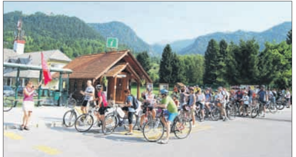
Takole se je na prvo Begunjsko avanturo podalo 74 kolesarjev iz vse Slovenije.

»Naš namen je bil privabiti več ljudi in jim pokazati, da se včasih splača podati na manj obljudene poti, kajti tam lahko vedno odkrijemo najlepše stvari. Program je tako povezoval ljudi, domačine, ki se ukvarjajo z najrazličnejšo obrtjo, lokalne naravne in kulturne znamenitosti ter zanimive, zabavno in tematsko zasnovane naloge. Povezali smo se »stari in mladi«, tako kolektiv turističnega društva v organizaciji kot tudi udeleženci na prireditvi. Okolico so