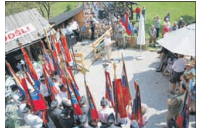
Osrednje prizorišče slovesnosti na Vodiški planini, kjer se je preteklo soboto zbralo okoli tisoč ljudi.